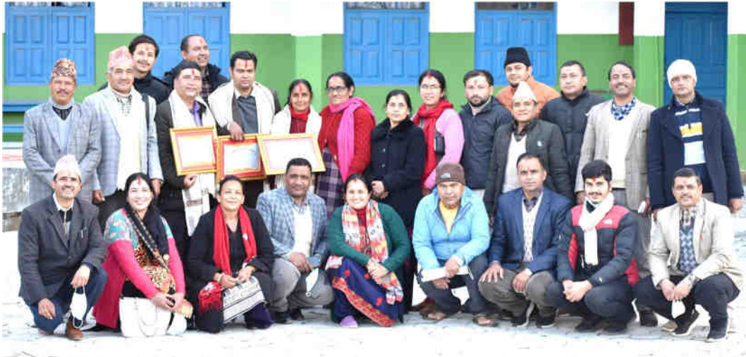
क्याम्पसको वार्षिकोत्सव-२०७८ मा पुरस्कृत शिक्षक तथा कर्मचारीका साथमा क्याम्पस परिवार