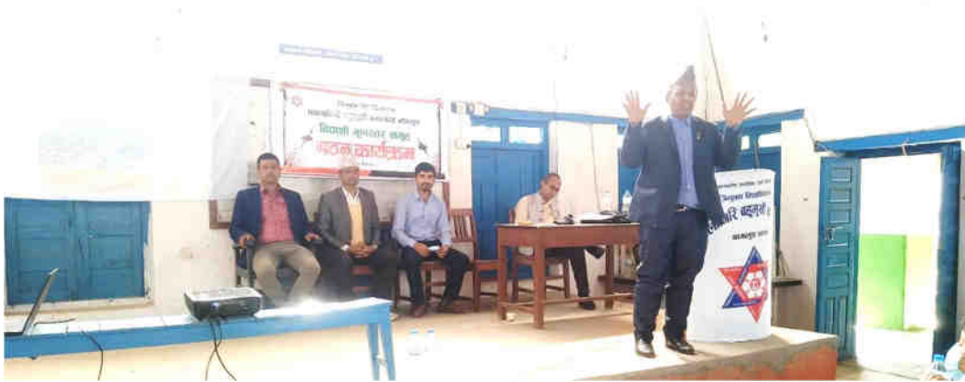
बिबिएस प्रथम वर्षमा भर्ना भएका विद्यार्थीहरूका लागि आयोजित स्वागत तथा अभिमुखीकरण कार्यक्रमका सहभागीहरू