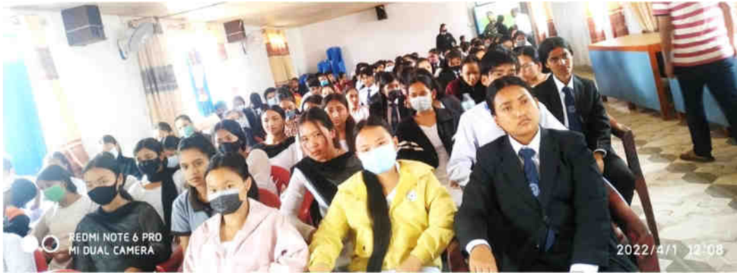
बिएड र बिए प्रथम वर्षमा भर्ना भएका विद्यार्थीहरूका लागि आयोजित स्वागत तथा अभिमुखीकरण कार्यक्रमका सहभागीहरू