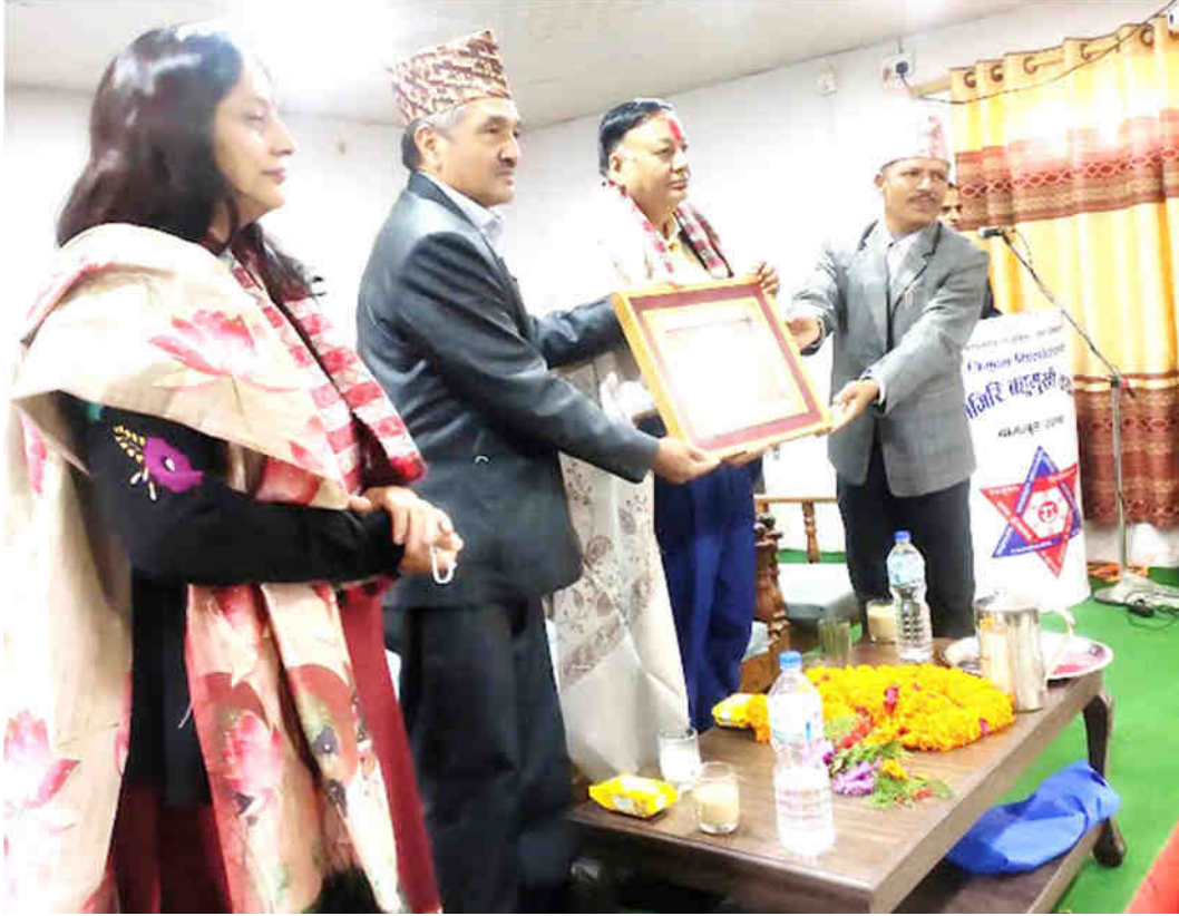
नेपाल सरकारका माननीय शिक्षा विज्ञान तथा प्रविधि मन्त्री देवेन्द्र पौडेललाई सम्मान-पत्र प्रदान गर्दै