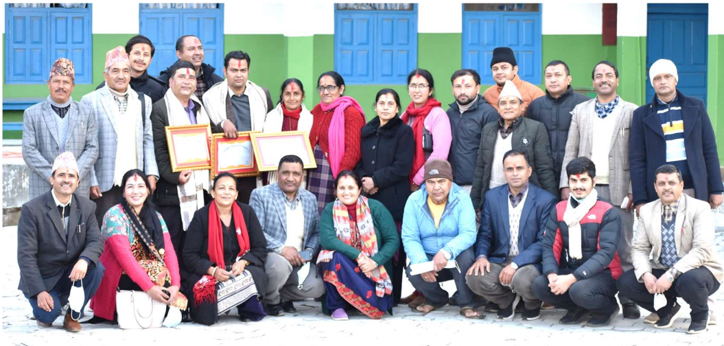
क्याम्पसको वार्षिकोत्सव-२०७८ मा पुरस्कृत शिक्षक तथा कर्मचारीका साथमा क्याम्पस परिवार