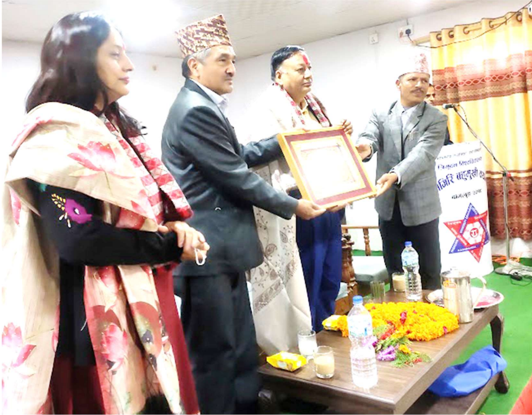
नेपाल सरकारका माननीय शिक्षा विज्ञान तथा प्रविधि मन्त्री देवेन्द्र पौडेललाई सम्मान-पत्र प्रदान गर्दै