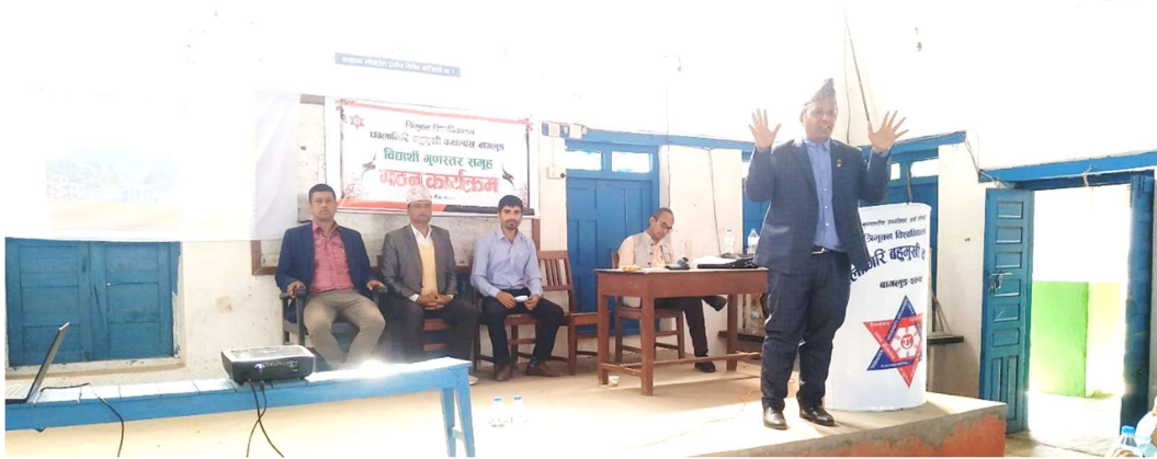
बिबिएस प्रथम वर्षमा भर्ना भएका विद्यार्थीहरूका लागि आयोजित स्वागत तथा अभिमुखीकरण कार्यक्रमका सहभागीहरू