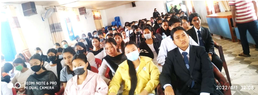
बिएड र बिए प्रथम वर्षमा भर्ना भएका विद्यार्थीहरूका लागि आयोजित स्वागत तथा अभिमुखीकरण कार्यक्रमका सहभागीहरू